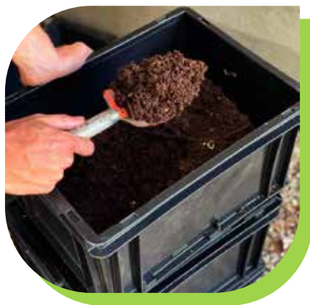
Compostera en interior