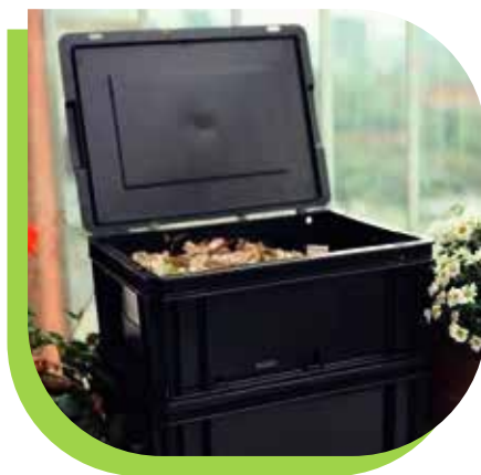
Compostera en balcón