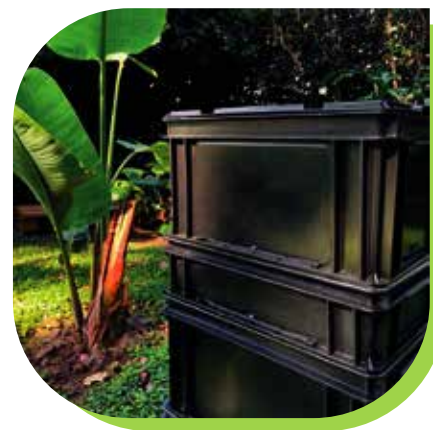
Compostera en patio