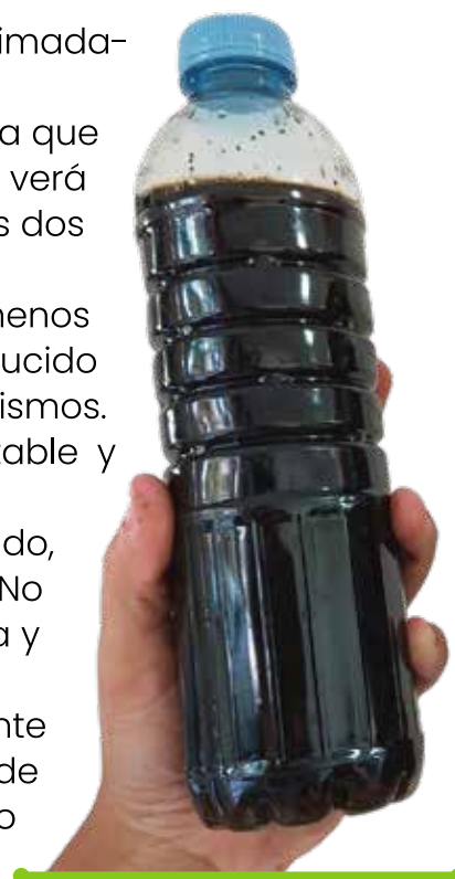
Lixiviado de 3 meses de maduración

Se puede utilizar en todo tipo de plantas como fertilizante orgánico diluyendo siempre 1 parte de lixiviado en 15 partes de agua y regar con esa solución una vez cada 15 días como mínimo.